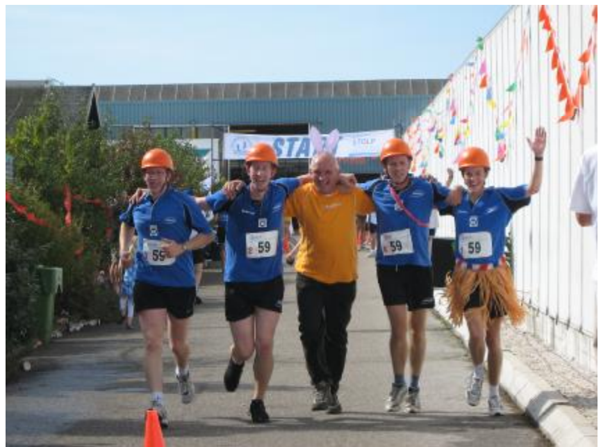
De laatste meters tot aan...