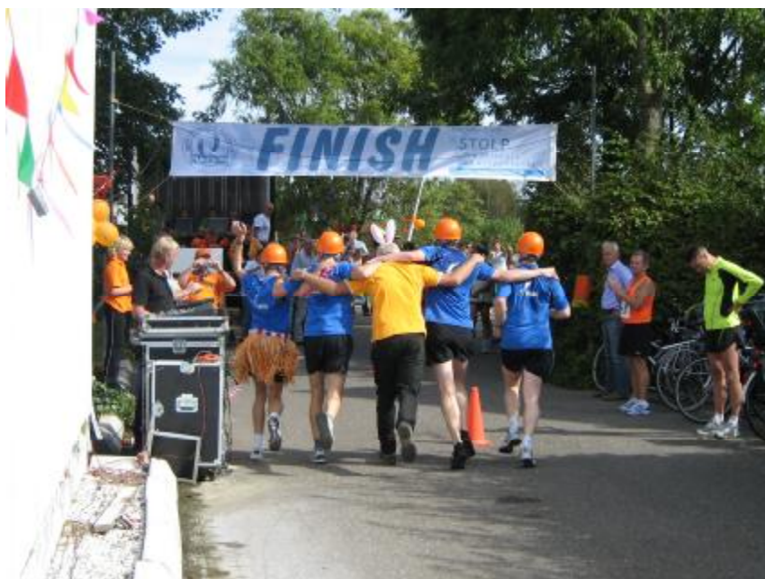
... de finish!!!