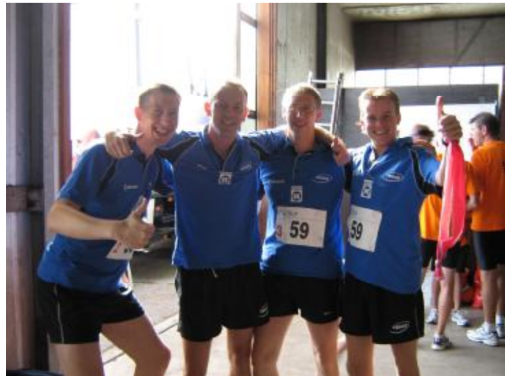
... en de onofficiële.