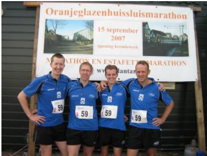
De officiële teamfoto...