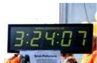
En dit was onze eindtijd!!!